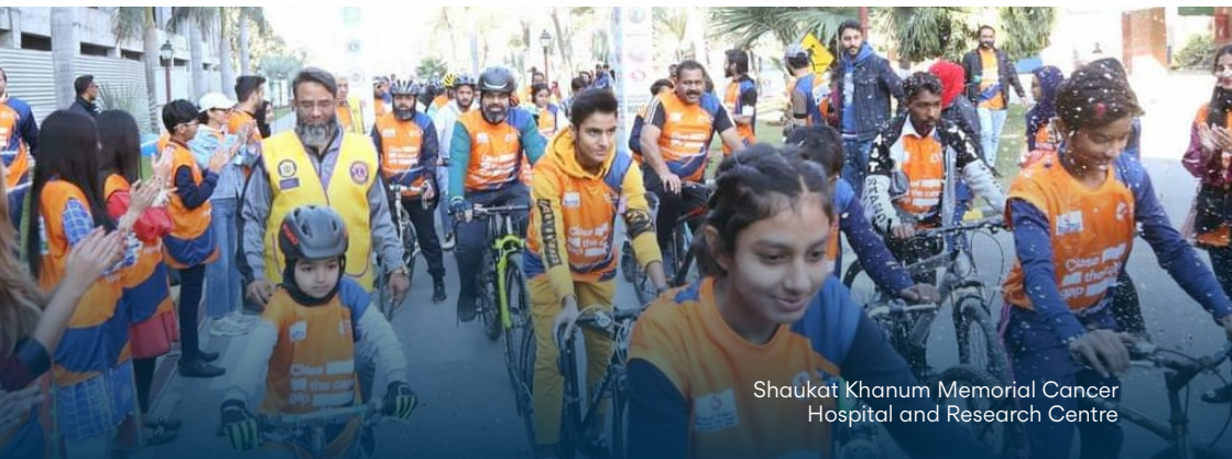
Shaukat Khanum Memorial Cancer Hospital and Research Centre